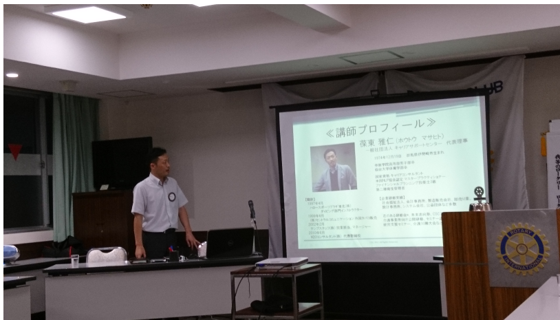
深東雅仁職業奉仕委員長、ありがとうございました。